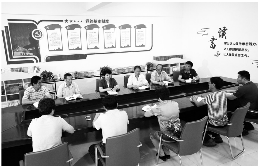
图为三涧溪村“两委”干部学习党的十九大精神

针对村里小锻打、小煤矿等“四小”产业污染环境的问题,村“两委”下定决心:“四小”企业效益再好,