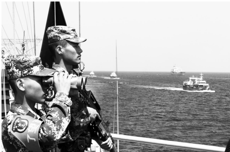
海军海口舰官兵正在执行第27批护航任务。

登上海口舰,这句醒目的标语吸引了记者的目光。海口舰政委邹琰深有感触地说:“这既是官兵的精神坐标,也是他们的真实写照。”