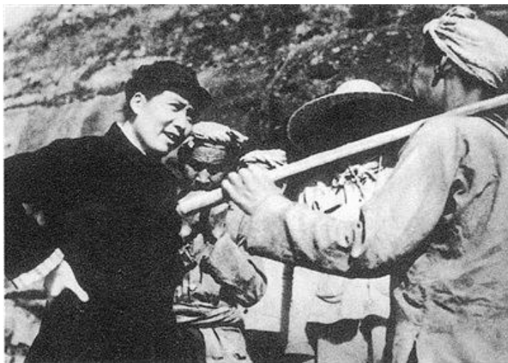
在延安,毛泽东与当地农民亲切交谈

1921年7月,中国共产党成立了。28岁的毛泽东是党的第一次全国代表大会13名代表之一。代表们的平均年龄,正好也是28岁。当时全国只有58名党员,在4亿人口的中国,无疑是沧海一粟。但这个信仰马克思列宁主义的政党,硬是像原子裂变般爆发出惊人的能量。经过28年的艰难曲折,终于夺取了全国政权,创建了一个新国家。