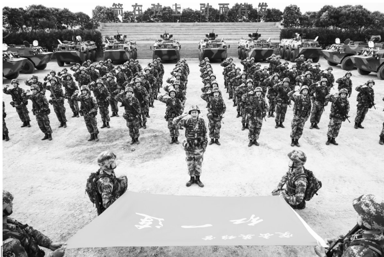
“红一连”官兵面向连旗宣誓。

红色精神铸就钢铁劲旅。2017年12月的一天早上，天刚蒙蒙亮，一阵急促的紧急集合哨声划破长空，