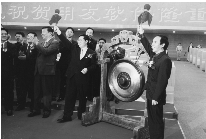
2001年,用友软件在上海证券交易所上市

王文京也品尝过失败的滋味。同样是1996年,windows系统在国内大量普及,由于没有看到它日后的战略价值,用友并未及时将自己的财务软件与之匹配,结果走了一段弯路,遭受了不小的市场损失。