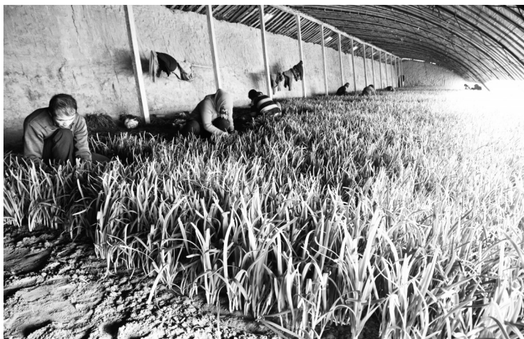
图为铁人村“冬韭王”韭菜农民专业合作社引导群众发展日光温室大棚

只有建成坚强有力的支部班子,才能充分发挥基层党组织的战斗堡垒作用。近年来,铁人村深入开展“坚强堡垒”争创活动,积极建立以村党支部为核心,党员群众、种植大户、科技能手、流通能人为主体的,以妇女、民兵等为补充的“一核多元”组织架构,依托“冬韭王”韭菜农民专业合作社,引导群众积极发展日光温室大棚、设施养殖、高效制种、劳务输转等促农增收产业。全面实施“支部+合作社+基地”的产业发展服务模式,抓好引导、带动、帮建、服务四个环节,由支部委员每人联系2~3名党代表,党代表每人联系2~3名党员,有联系能力的党员每人联系1~2名群众,帮扶群众400余人。铁人村通过整合各方力量,让党组织建在产业链、党员聚在产业链、群众富在产业链,聚合效应不断释放。据了解,铁人村现已建成日光温室1141座,实现了户均2座增收棚的目标,来自日光温室的收入占到总收入的40%,2017年全村农民人均纯收入达到16420元。