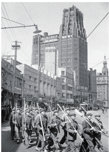
“南京路上好八连”的战士们参加劳动归来

以“好八连”官兵为原型创作的话剧《霓虹灯下的哨兵》,讲述了八连用艰苦奋斗精神培育官兵的故事,感动了几代人。一代代八连官兵