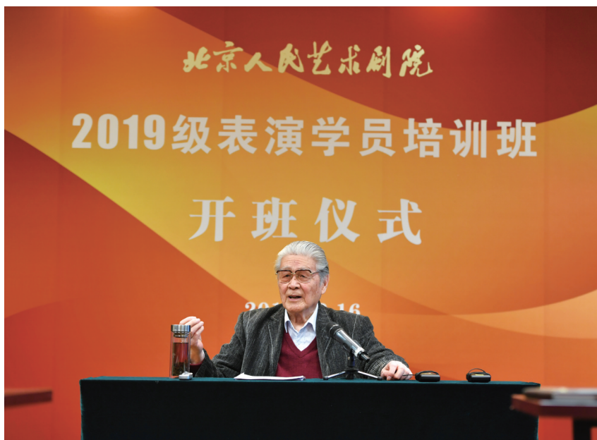
蓝天野为表演学员培训班授课

2011年,北京人艺排演了庆祝建党90周年大戏《家》。已经84岁高龄的蓝天野,怀揣共产党员的初心与使命,毅然在阔别舞台19年后重新登台。排演话剧任务繁重,读剧本、揣摩人