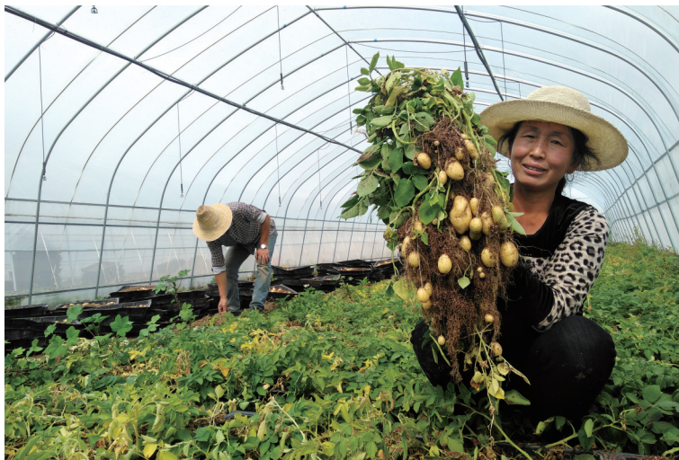
微型薯种植成为德胜村的“得胜”法宝,图为村民喜获丰收的情景。

“火车跑得快、全靠车头带,脱贫攻坚的火车头就是党支部。”近年来,村党支部和驻村扶贫工作队一道,精准制定脱贫攻坚思路举措,争取项目、引进企业、联系市场,带着群众闯出产业发展新路子。德胜村2018年换届后,村“两委”成员由原来的4人增加到现在的8人,力量